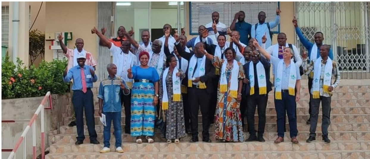
Photo de famille (la nouvelle gouvernance avec quelques membres du réseau FAR-CI) après l'AG.

C'est à Yamoussoukro que s'est tenu, les 29 et 30 mars 2024 au Centre des Innovations et des Technologies de l'Anacarde (CITA), la troisième rencontre annuelle : Assemblée Générale de renouvellement des instances de gouvernance du Réseau Formation Agricole et Rurale Côte d'Ivoire (FARCI). Cet événement placé sous le thème « Intensifier de façon durable la production agricole pour promouvoir l'autonomie alimentaire et stimuler la croissance économique : quelles contributions de la Formation agricole et rurale ? », a réuni un ensemble diversifié d'acteurs du secteur agricole, des professionnels de la formation, des représentants institutionnels, des experts et étudiants de l'École Supérieure d'Agronomie (ESA).