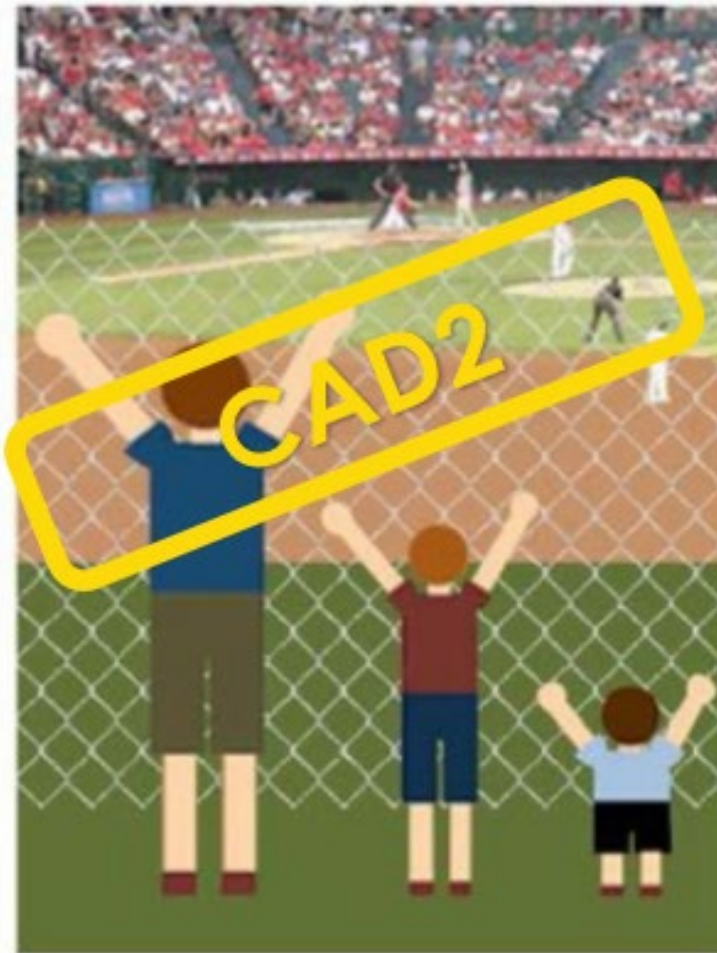
L'obstacle structurel a été éliminé.