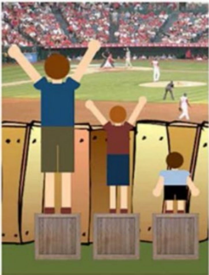
Ils sont traités de la même façon, égale.