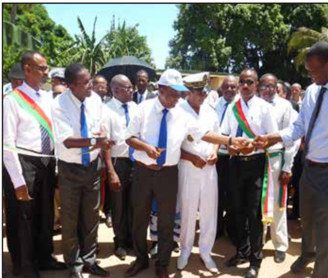
Ekipa CAFPA ANDRARANGY Maintirano

Ny vahoaka ao Melaky dia maneho fisaorana feno sady mankasitraka ny fitondram-panjakana amin'ny tsy nanaovany afaran-dahatsy an'ireo tanoran'i Melaky.