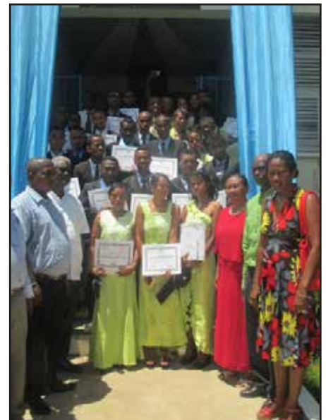
Equipe EASTA-Pro Ambanja

Les nouveaux diplômés ont fêté leur réussite par une soirée de promotion qu'ils ont partagée