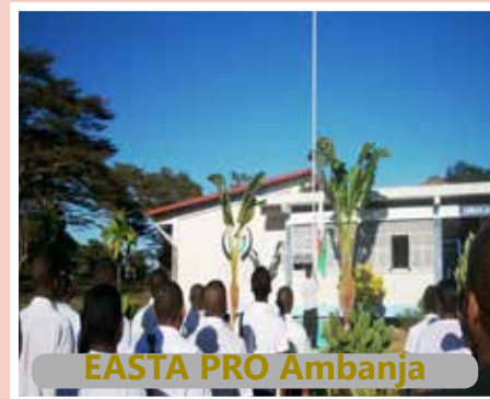
EASTA PRO Ambanja