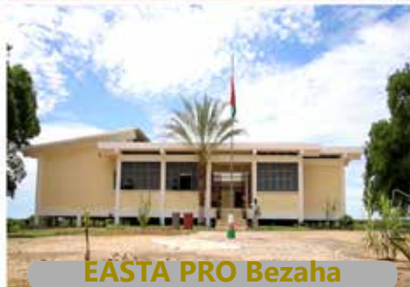
EASTA PRO Bezaha

Le régime de la formation pour les deux niveaux est l'internat.