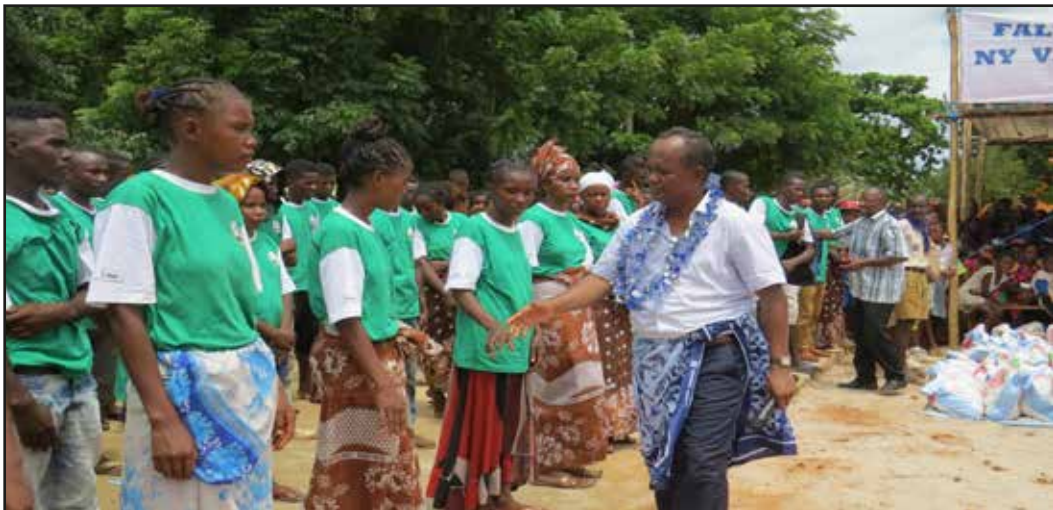
Monsieur Le Ministre chargé de l'Agriculture et de l'Elevage, félicitant les jeunes formés en pêche maritime à Besalampy

Ces jeunes (photos ci-dessous), de la Région de Melaky, venant de villages très enclavés, sont venus en masse à BESALAMPY, le chef lieu de district pour recevoir leur certificat de fin de formation le 17 mars 2017. Ces jeunes ont été formés sur la Pêche maritime, un métier populaire dans la région. La formation s'est déroulée dans les villages, et les jeunes sont très motivés d'apprendre et de suivre la formation. Une motivation qui s'est manifestée par leur engagement et leur assiduité depuis l'organisation de la formation dans les villages jusqu'à la cérémonie de remise de certificat de fin de formation, qui s'est tenue, à BESALAMPY, se trouvant à 6 heures de marche à pied de chez eux.