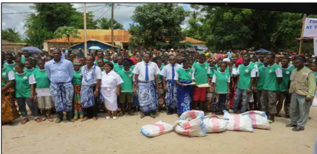
Monsieur le Ministre, le Chargé de Programme FIDA à Madagascar, les chefs de Région Menabe et Melaky, le Chef de District avec les jeunes formés