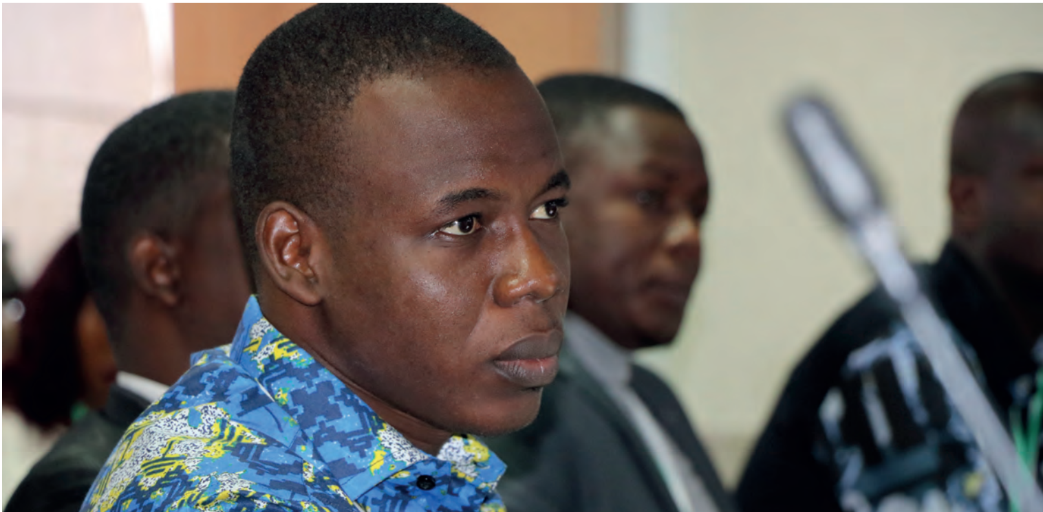
Inoussa Maïga / Mediaproduct

conservateurs ni additifs chimiques. Cette purée de tomate est commercialisée sous la marque Tanko Timati. La spécificité du produit est qu'il apporte une solution non seulement aux agriculteurs face à leur détresse lors de la perte de leurs récoltes, mais aussi aux consommateurs en mettant à leur disposition de la tomate fraîche à un prix raisonnable tout au long de l'année. « Nous rachetons des quantités importantes de tomates puis les transformons afin d'allonger leur durée de conservation. L'accent est mis sur l'aspect naturel de notre produit », précise Tanko. En ce qui concerne l'approvisionnement de l'entreprise en matière première, Ismaël a commencé par s'approvisionner dans les marchés locaux