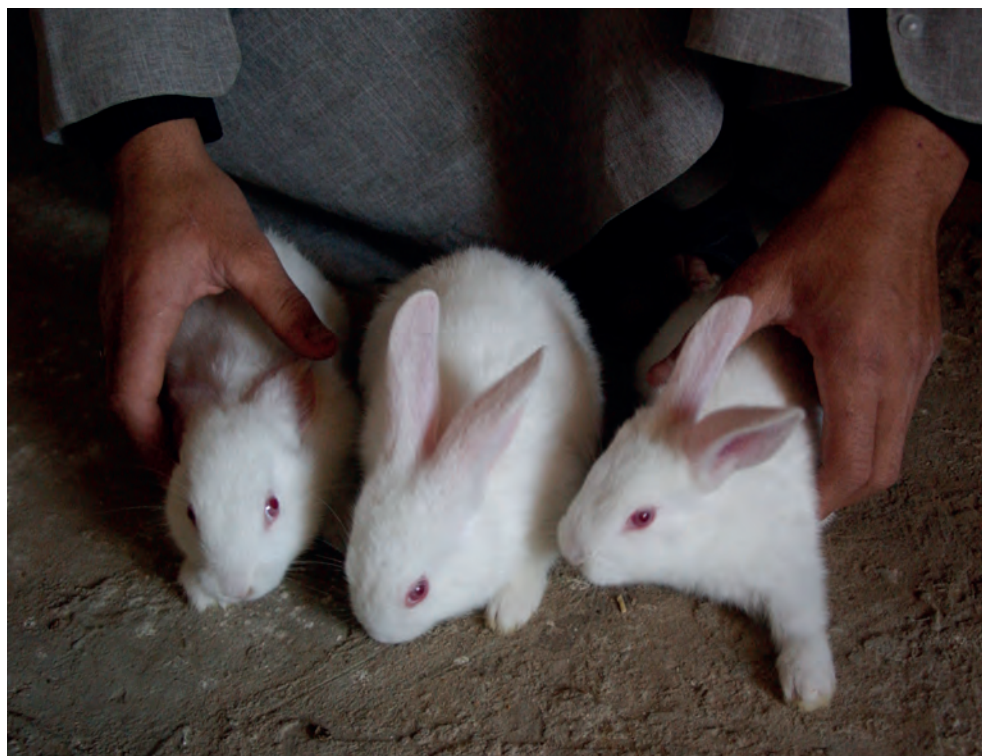
Ami Vitale / FAO