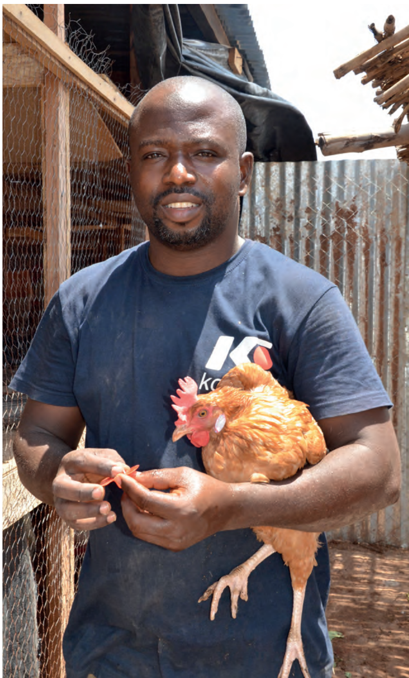
Mahamadi Ouédraogo / Mediaprod

rendu compte qu'il s'agissait d'une source potentielle de revenus », expose l'entrepreneur burkinabé. Richard s'engage alors dans l'acquisition d'un terrain fin 2013 à Loumbila (commune rurale située à une vingtaine de kilomètres de la capitale) alors que s'achève son contrat à l'IRD et qu'il obtient un poste de chargé de programme au Drylands Development Programme (DryDev) à Ouagadougou. Si sa première motivation demeure la passion de l'élevage, Richard a aussi remarqué que tous les cadres formés dans les écoles d'agronomie finissent par exercer dans des bureaux et souhaitait ainsi montrer une autre image de l'agriculture. De plus, l'entrepreneur constate rapidement que l'aviculture est une activité lucrative : « Sur le plan économique, l'élevage se porte très bien et, si on s'y investit, il y a de fortes chances pour que l'on puisse vendre. » En 2014, Richard crée le Complexe agricole du Sahel (Cagris), entreprise qui formalise l'ensemble de ses activités. Quand on lui demande pourquoi il s'est lancé dans cette activité, il répond : « J'ai voulu me lancer dans l'aviculture moderne et aussi montrer à la jeunesse qu'on peut réussir dans l'agriculture et même y créer des emplois. »