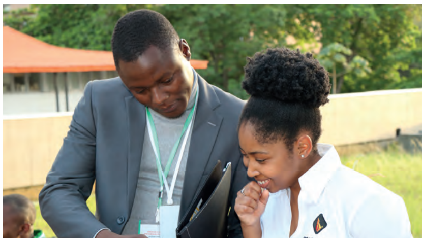
Inoussa Maïga / Mediaproduct