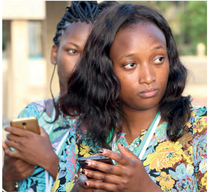
Inoussa Maïga / Mediaprod

L'entreprise est basée au Kenya, plus précisément dans la ville de Kiambu, et travaille en étroite collaboration avec les petits producteurs de manioc pour assurer aux consommateurs la meilleure qualité de farine de manioc. L'objectif de l'entreprise