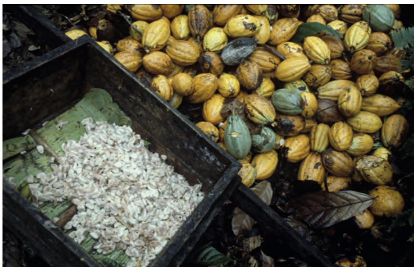
K. Boldt / FAO

de valorisation des produits locaux qui m'ont motivées : le riz est importé, les jus de fruits sont importés. Il n'y a rien de considérable dans le secteur agroalimentaire. C'est pourquoi j'ai décidé de relever le défi et de me lancer », persiste Emmanuel.