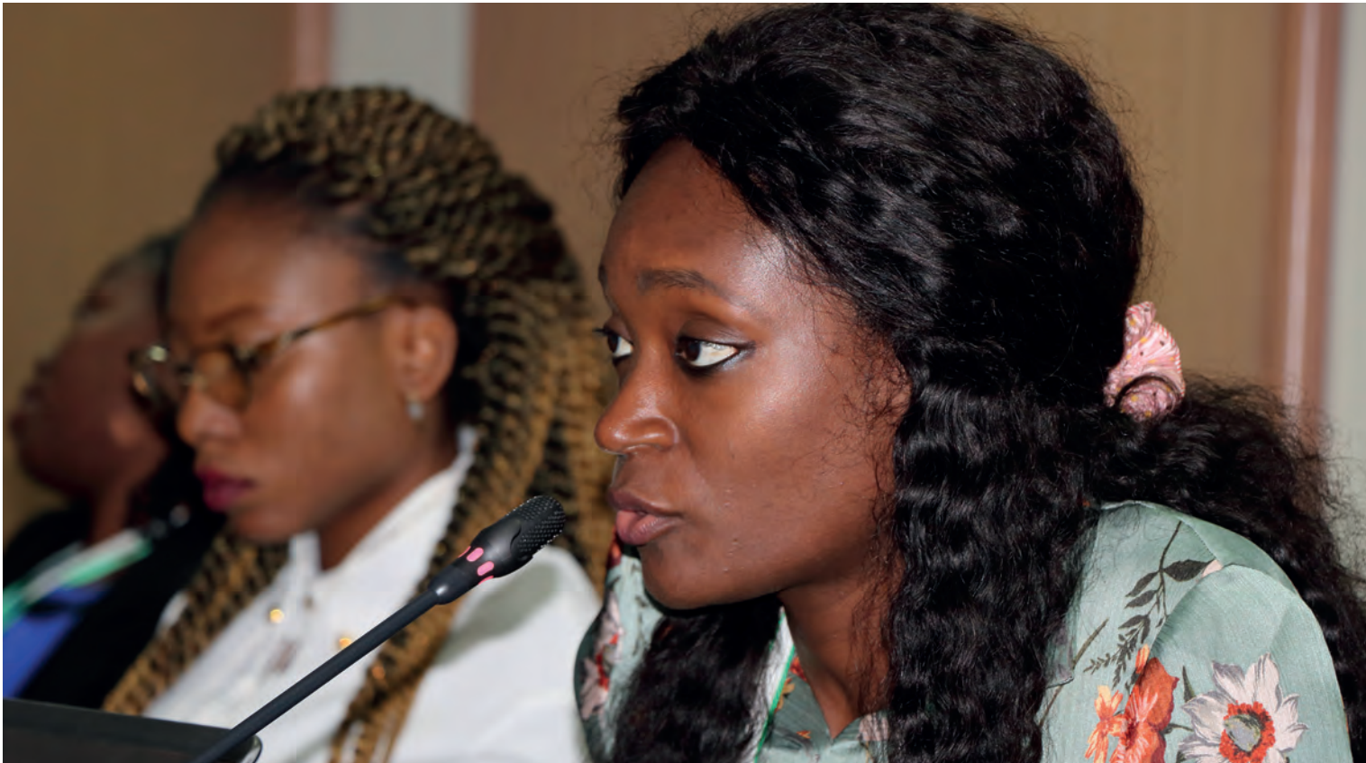
Inoussa Maïga / Mediaprod

appréciés mais que, malheureusement, vous ne retrouvez plus dans les supermarchés. Nous proposons aux clients une manière pratique et fiable de se les procurer : depuis votre ordinateur, faites le marché en gros ou en détail et payez à la livraison », promeut Awa. Les clients consommateurs de Sooretul sont des Sénégalais, en majorité la classe moyenne de Dakar et une partie de la diaspora, mais aussi des entreprises, des ONG, des organisations internationales. Sooretul est actuellement membre de la plateforme des professionnels de l'agroalimentaire au Sénégal, qui regroupe plus de 500 GIE de femmes transformatrices au Sénégal dans tous les domaines : cosmétiques, produits