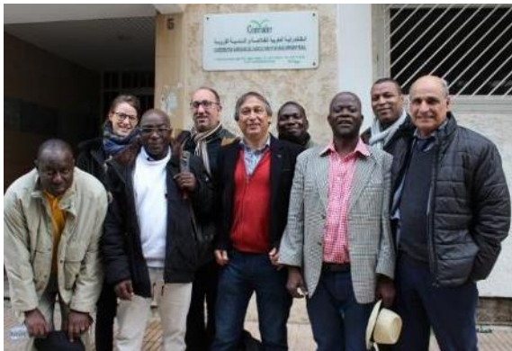
Animateurs régionaux, membres du Bureau et du Secrétariat exécutif du réseau FAR

Du 29 au 31 janvier 2018, s'est tenu à Rabat au Maroc un atelier de travail regroupant pour la première fois les quatre animateurs régionaux, les membres du Secrétariat exécutif (le Secrétaire exécutif, les deux chargés de mission et la gestionnaire financière) ainsi que les membres du Bureau du réseau international FAR (le Président, le Trésorier et le Secrétaire).