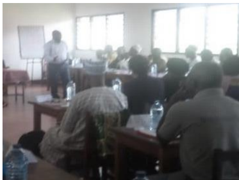
Les participants lors de l'atelier de partage de la démarche dans le cadre du programme AFOP au Cameroun

Depuis 2008, date du démarrage du processus de rénovation du dispositif de formation agricole et rurale camerounais conduit par le programme AFOP, trois générations de centres ont été accompagnés (76 centres au total). De nouvelles formations ont été développées dans les structures de formation. Elles ont concerné plusieurs parcours. En effet, les centres de formation sont concentrés sur la formation des Exploitants agricoles (EA) tandis que dans les écoles, plusieurs parcours ont été développés, notamment les entrepreneurs agro pastoraux (EAP), les conseillers agropastoraux (CAP), les Techniciens supérieurs en infrastructures, équipements