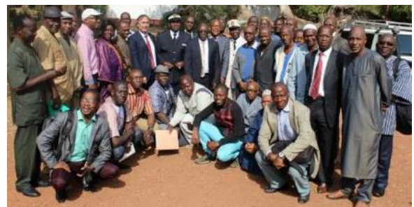
Participants à l'atelier de Mamou, Guinée

La République de Guinée a lancé officiellement le processus de formulation de sa Stratégie Nationale de Formation Agricole et Rurale (SNFAR). Il a eu lieu à l'occasion d'un atelier tenu à Mamou (Fouta Djalon) les 19, 20 et 21 février dernier.