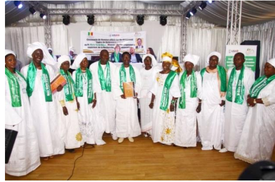
Remise du document par le comité au ministre de l'enseignement supérieur de la recherche et de l'innovation le 30 avril 2018 à Dakar

En perspective du renforcement des initiatives et processus d'institutionnalisation et d'opérationnalisation du genre, engagés par les parties prenantes, un cadre de référence a été conçu. Il doit servir de référentiel et permettre aux IFRCar d'identifier les différentes étapes afin de progresser dans la démarche méthodologique.