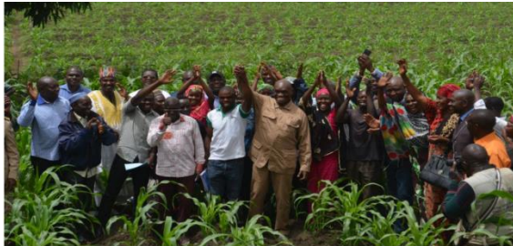
Acteurs d'AFOP et du MINADER célèbrent dans un champ de maïs le 3000ème jeune installé avec le programme AFOP

Pour en savoir plus sur les temps fort de cette célébration, cliquez ICI