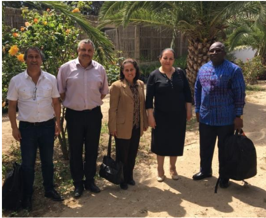
Membres du réseau FAR Tunisie et Burkina Faso