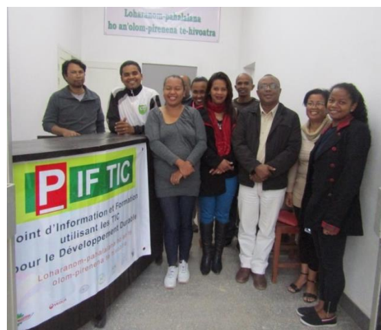
Participants de l'atelier les 31 mai et 1er juin dernier

Pour la suite des actions, le réseau FARMADA souhaite continuer dans cette voie afin d'opérationnaliser 4 centres de ressources dans les régions suivantes : Analamanga, Atsinanana, Analanjirifo et Amoron'i Mania.