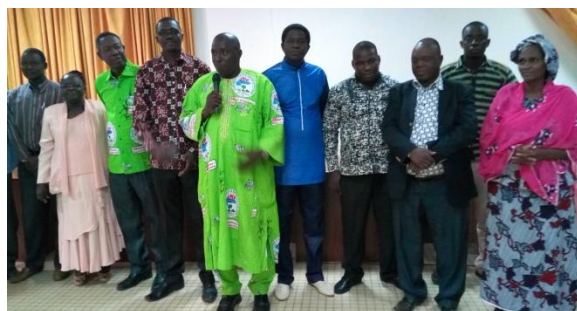
Le Bureau Exécutif du RNFAR-BF

↓ Pour en savoir plus sur la composition de ces organes, Cliquez ICI