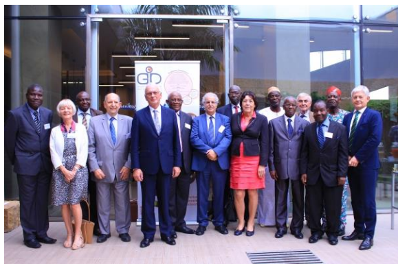
Participants du Forum d'échanges du Programme GID-FastDev Agri

d'Agriculture de France et les Académies africaines et françaises membres et partenaires du GID. Il constituait l'une des étapes de la mise en œuvre du programme GID-Fast Dev Agri , lancé par le Ministre français de l'agriculture en mars 2017 à Paris.