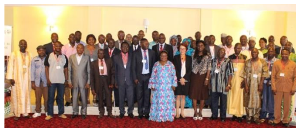
Photo de famille des participants de l'atelier

Au Burkina Faso, le Programme d'Appui au Développement Rural (PADER/GIZ) dans la mise en œuvre de sa composante « Formation Professionnelle Agro-Pastorale » (FPAP) s'est engagé dans un processus de co-construction d'un modèle opérationnel et d'outils consensuels de formation. C'est à ce titre qu'il s'emploie à développer une synergie d'actions entre les ministères sectoriels , les organisations professionnelles, les structures de formation et programmes d'appui à la formation professionnelle.